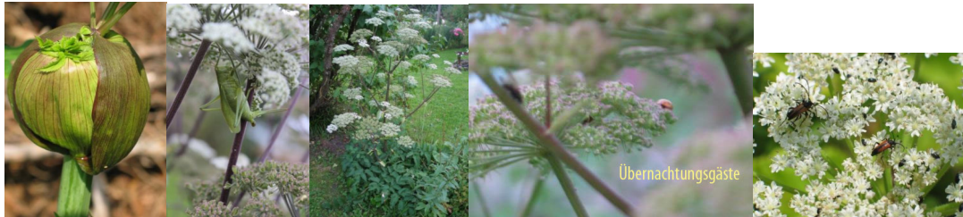
Angelika - von der Blattgeburt bis zu den Dauer-Übernachtungsgästen - ist das letzte Foto auch eine?